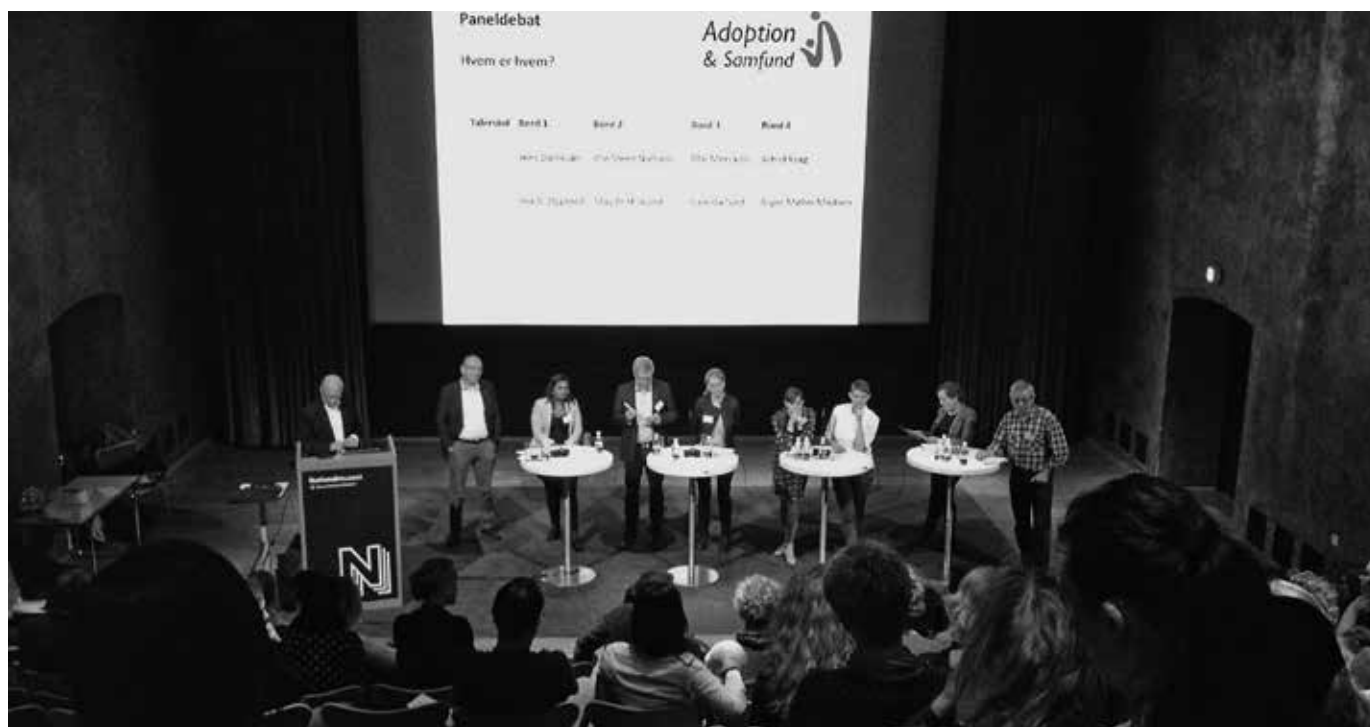
Et engageret panel diskuterer adoption nu og i fremtiden.

Arbejdsgruppens kommissorium fylder i alt 11 sider.