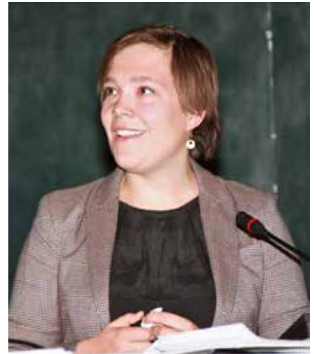
„Hvem skal have gavn af et videnscenter?“, spørger Astrid Krag, som er sendt i byen af socialdemokratiet.

finansloven“, og hun mente ligesom de andre Christiansborg-repræsentanter, at det vil være en god ide at vente med at tage store beslutninger, før en ny helhedsanalyse om adoption er færdig.