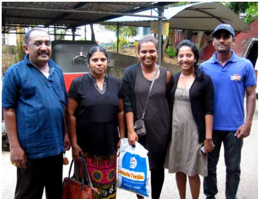
Her står jeg foran hospitalet Colombo South Teaching Hospital med ægteparret og deres to børn.