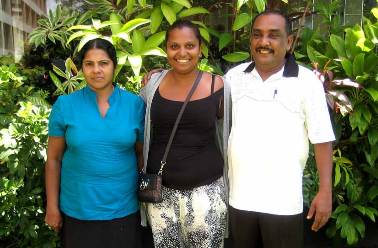
Jeg står foran hotellet med ægteparret.