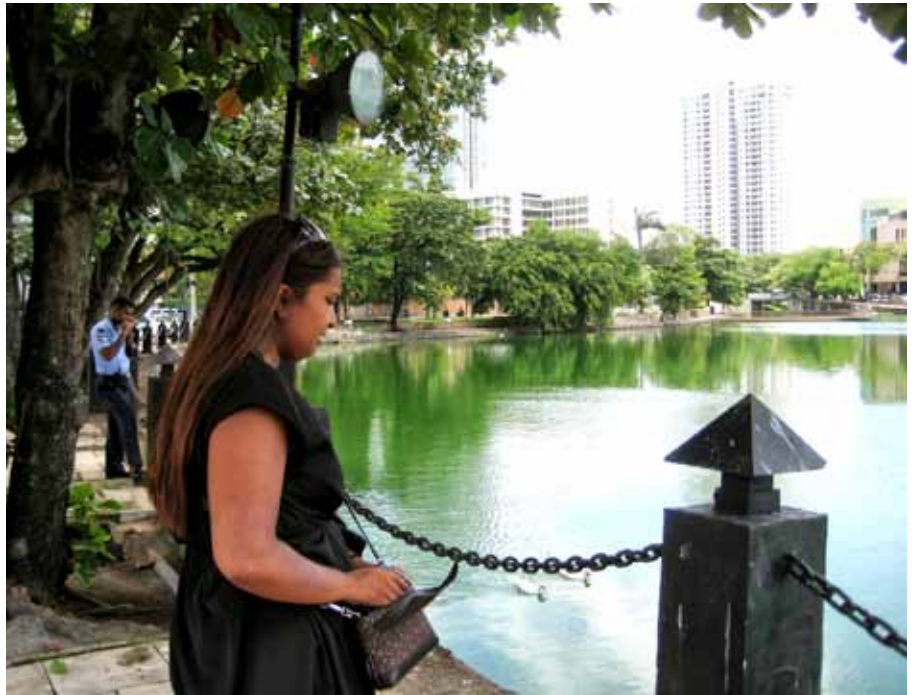
Jeg står ved søen i Colombo.

Han får også set bogen og min tatovering.