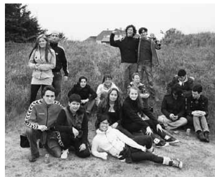
Hygge ved Slettestrand.

Vores børn har altid set frem til vore samlinger, hvor de møder ligestillede og udveksler erfaringer. De støtter og hjælper hinanden, såvel på samlingerne som i hverdagen. ■