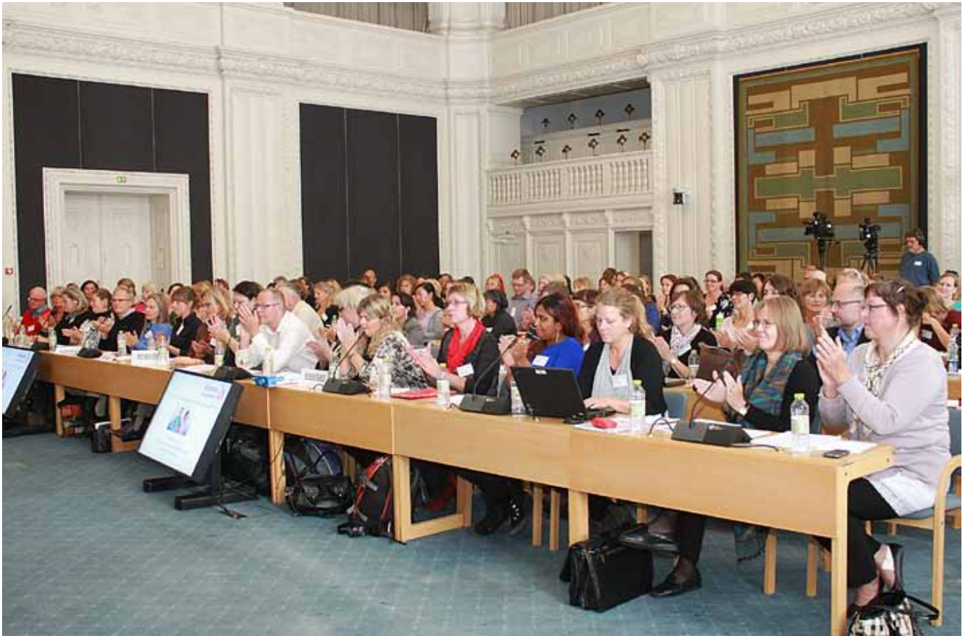
Der var livlig debat i Landstingssalen.