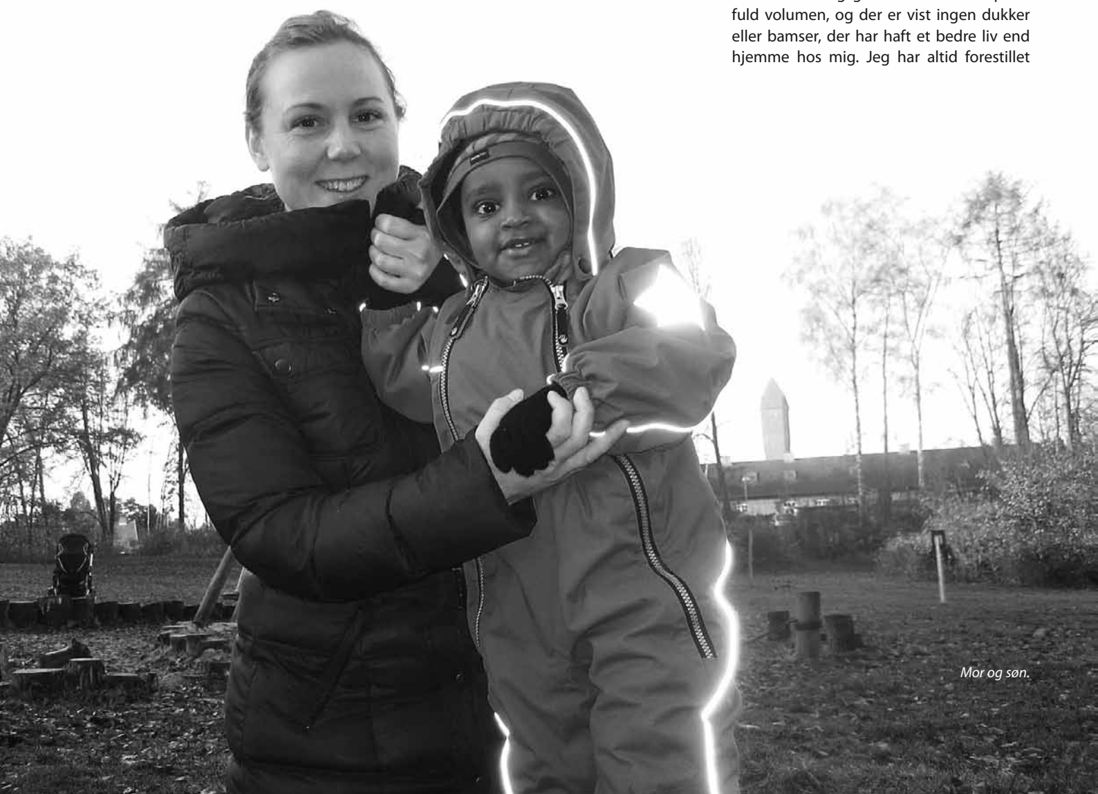
Mor og søn.

Jeg har egentlig altid vidst, at jeg gerne ville være mor. Lige fra jeg har været helt lille, har mit omsorgs-gen været skruet op for fuld volumen, og der er vist ingen dukker eller bamser, der har haft et bedre liv end hjemme hos mig. Jeg har altid forestillet