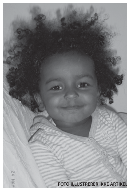
FOTO ILLUSTRERER IKKE ARTIKEL