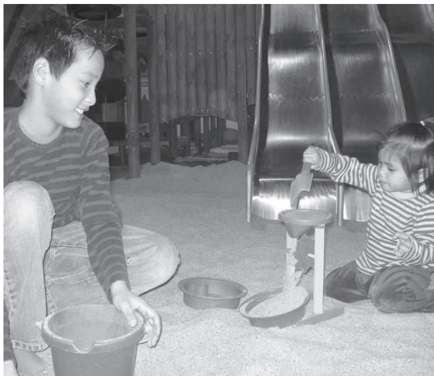
Storebror og lillesøster hygger sig i sandkassen i Legeland i Viborg ved LF Gudenåens arrangement den 2. marts.