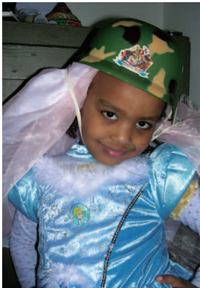
Stilforvirring?! Medferiashwork er 5 år og født i Etiopien.

Familiestyrelsen Stormgade 2-6 1470 København K E-mail: familiestyrelsen@famstyr.dk