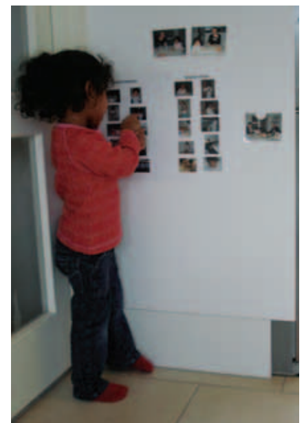
Marie med sine små piktogrammer. De hjælper hende til at få struktur og mere overskuelighed i hverdagen og betyder, at hun har mere ro og overskud til bare at være 3½ år og gå i børnehave.

Jeg kan huske, at min mand og jeg kiggede på hinanden. "Jamen hun er jo så lille, det tror jeg ikke, hun vil kunne forstå," sagde jeg. "Nej måske ikke, men prøv lige alligevel." Samtidig nåede vi frem til, at vi jo kunne lave en lille billedbog/fotoalbum med de få billeder fra hun var en lille baby, billeder fra børnehjemmet, billeder fra børnehjemmet af et andet barn, som hun kender etc. Noget der kunne hjælpe hende til at forstå, hvad der var gået forud. Det hun ikke kunne sætte ord på og som måske var med til at give frustrationer.