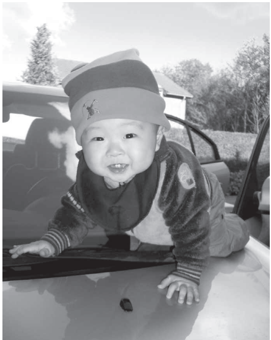
Daniel Min-Wu 8 mdr. Fars bil er nu ikke så tosset – men mangler den ikke en galionsfigur? Foto illustrerer ikke artiklen.

"Sådan en lille ting som at blive pludret til når man bliver badet, eller smilet til, når man bliver madet,