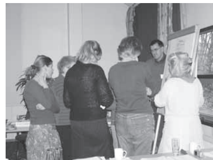
Ved hjælp af tavler blev alle inddraget i debatten om, hvordan foreningen skal arbejde i det kommende år

der skrevet forslag til temaer, som Adoption & Samfund skal arbejde med det kommende år. På denne måde blev alle inddraget i debatten om, hvad det er foreningen skal lægge vægt på, og der var både aktivitet og livlig debat ved de forskellige tavler.