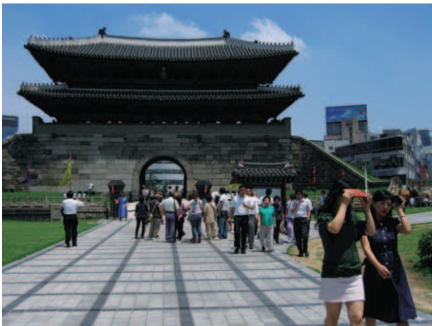
Gammel koreansk bygning inde i bykernen af Seoul

tede derfor på et Lotte-hotel, ved én af de populære strande nær Seoul, samt kørte en dagstur op til den demilitariserede zone, der skiller Nord og Sydkorea. Hvilket var en meget speciel oplevelse. Ved broen over til Nordkorea er der sat et hegn op. Her hænger sydkoreanske familiemedlemmer hilser op til deres familiemedlemmer, der er tilbage i Nord. Samtidigt kan man ind imellem, i betalingskikkerterne, se nordkoreansk militær patruljere deres side af broen. Et af turens ubestridte højdepunkter var dog, da vi mødte den koreanske præsidentfrue til et kort eftermiddags-visit i det Blå Hus, som er præsidentfrue-paladset.