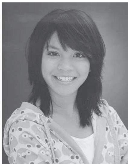
Samida er 12 år og født i Thailand.