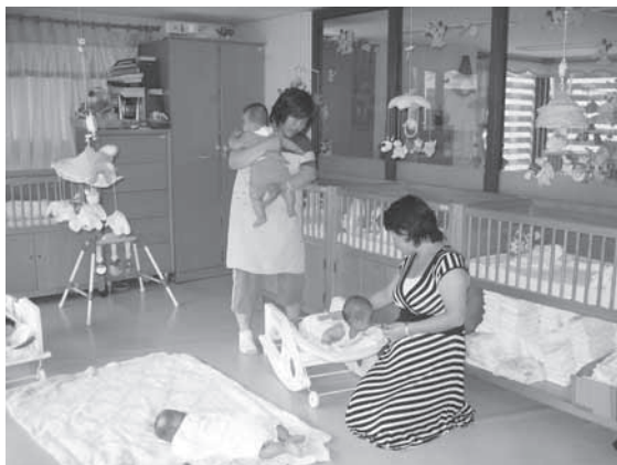
En plejemor og en daglig leder af Holt med tre små børn

Det var en 10 dages hektisk tur med et fast program hver eneste dag. Den første aften stod på koreansk undervisning og de næste dage, der fulgte, var ét stort bombardement af bl.a. koreansk madlavningskursus og traditionel musik, hvor vi blandt andet fik en håndskåret ko-