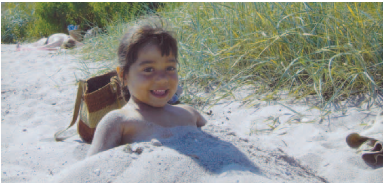
Nanna begravet i sand. Hun er født i Ungarn. Dette foto illustrerer ikke artiklen.

Under debatten blev der fra salen bl.a. udtrykt ønske om et opfølgningskursus ca. et halvt år efter barnets hjemkomst.