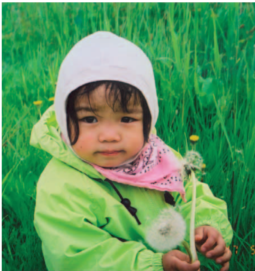
Mille Hefan er 2 år og født i Kina. Dette foto illustrerer ikke artiklen.

Bogen er udgivet på forlaget Madsen www.forlagetmadsen.dk og koster 249 kr. Den er udgivet med støtte fra AC Børnehjælp. □