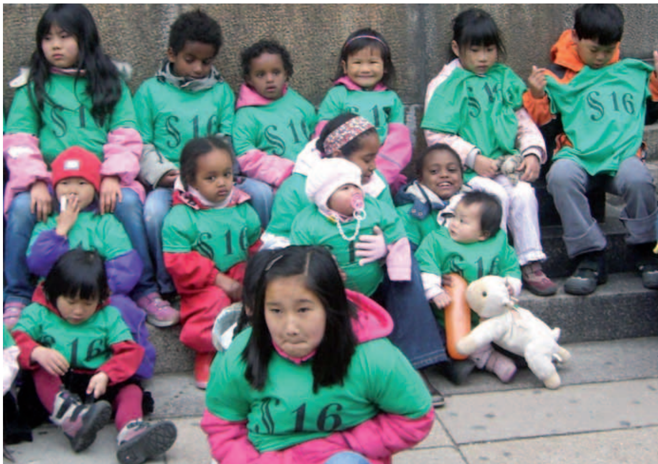
Der var stort fremmøde foran Christiansborg.

Adoption & Samfund fortsætter det politiske arbejde for at få rettet op på diskriminationen af adoptivbørnene, og bakker op om sagen ved menneskerettighedsdomstolen i Strasbourg.