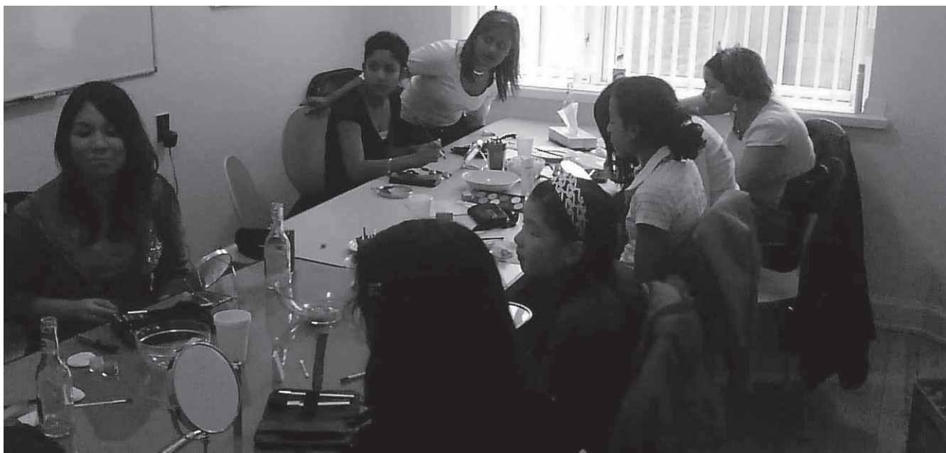
Ni unge piger i fuld gang med make-up, farver og hudpleje.

LF Viborg Amt havde den 17. marts kl. 15-17 arrangementet: "En lørdag for pigerne". Det kostede 60 kroner at deltage. Med i prisen var også forfriskninger og en lille gave fra Matas med en mascara og to parfume-prøver.