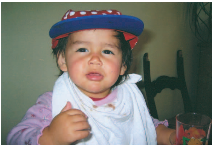
Cajsja med kasket, 17 mdr. og født i Colombia.

Den afvisende voksne svarer kort, tillægger ikke tilknytning eller tab nogen betydning for sig selv og idealiserer tidlige tilknytningsfigurer