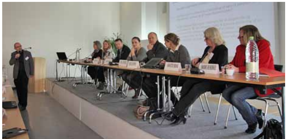
Paneldebatten er i gang.

Nogle adoptivbørn får det svært i en børnegruppe, fx en klasse, på grund af deres