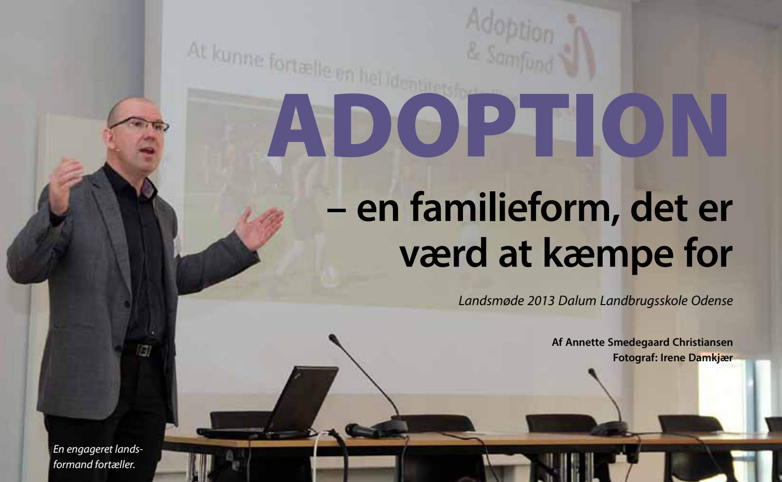
En engageret landsformand fortæller.