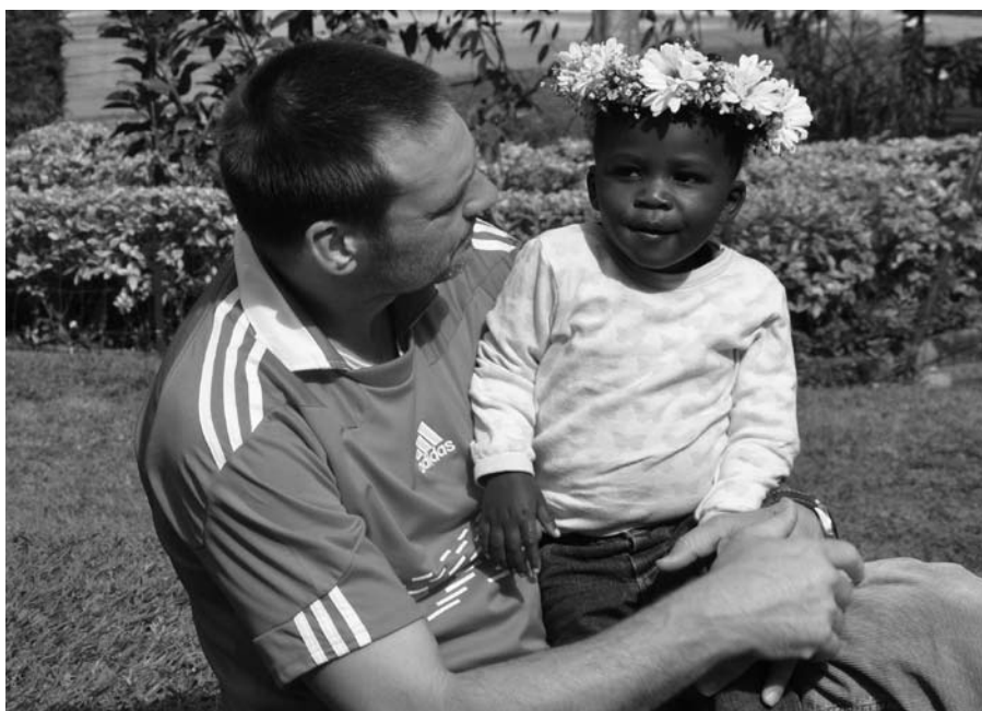
Skt Hans fejres med svensk midsommerkrans og kenyansk 'vintervej'.