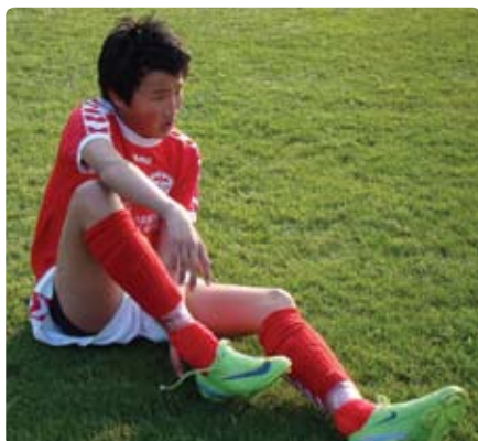
Fodboldhagen Bjørn er 15 år og født i Korea.