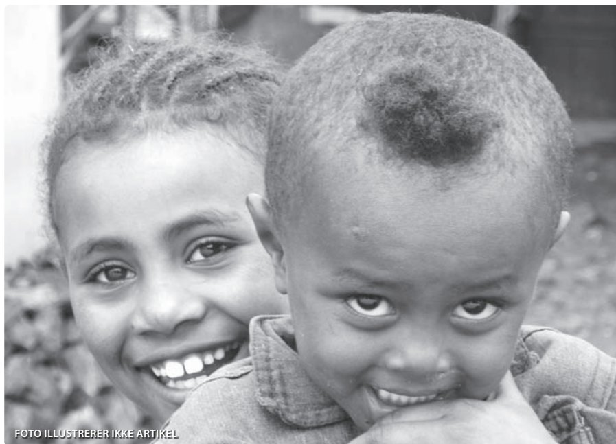
FOTO ILLUSTRERER IKKE ARTIKEL