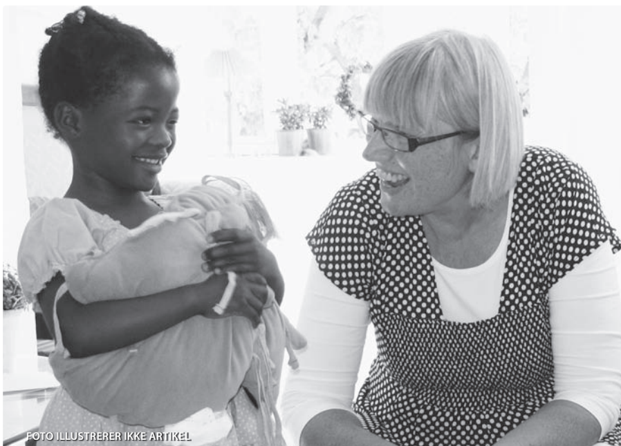
FOTO ILLUSTRERER IKKE ARTIKEL