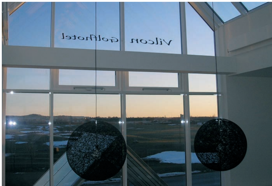
Et kig fra hotellet...

Flere adoptanter overvejer special needs børn, og her går de formidlendes rådgiv-