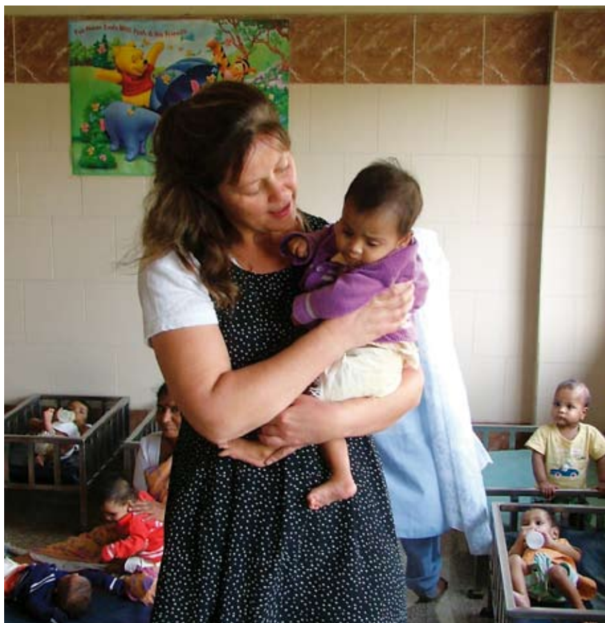
Artiklens forfatter med én af babyerne.

For os voksne var det vigtig, at turen netop gik til Indien, men for ungerne tror jeg lige så godt, det kunne have været Thailand. De kunne ikke relatere sig selv til inderne og Indien og blev irriterede, når folk henvendte sig til dem på maharati, hindi eller et andet af Indiens sprog. Måske kan de bedre identificere sig med Indien og inderne, når vi besøger landet igen, for det gør vi uden tvivl, når de er blevet lidt ældre. Gad vide, om de kan genkende lugten til den tid? □