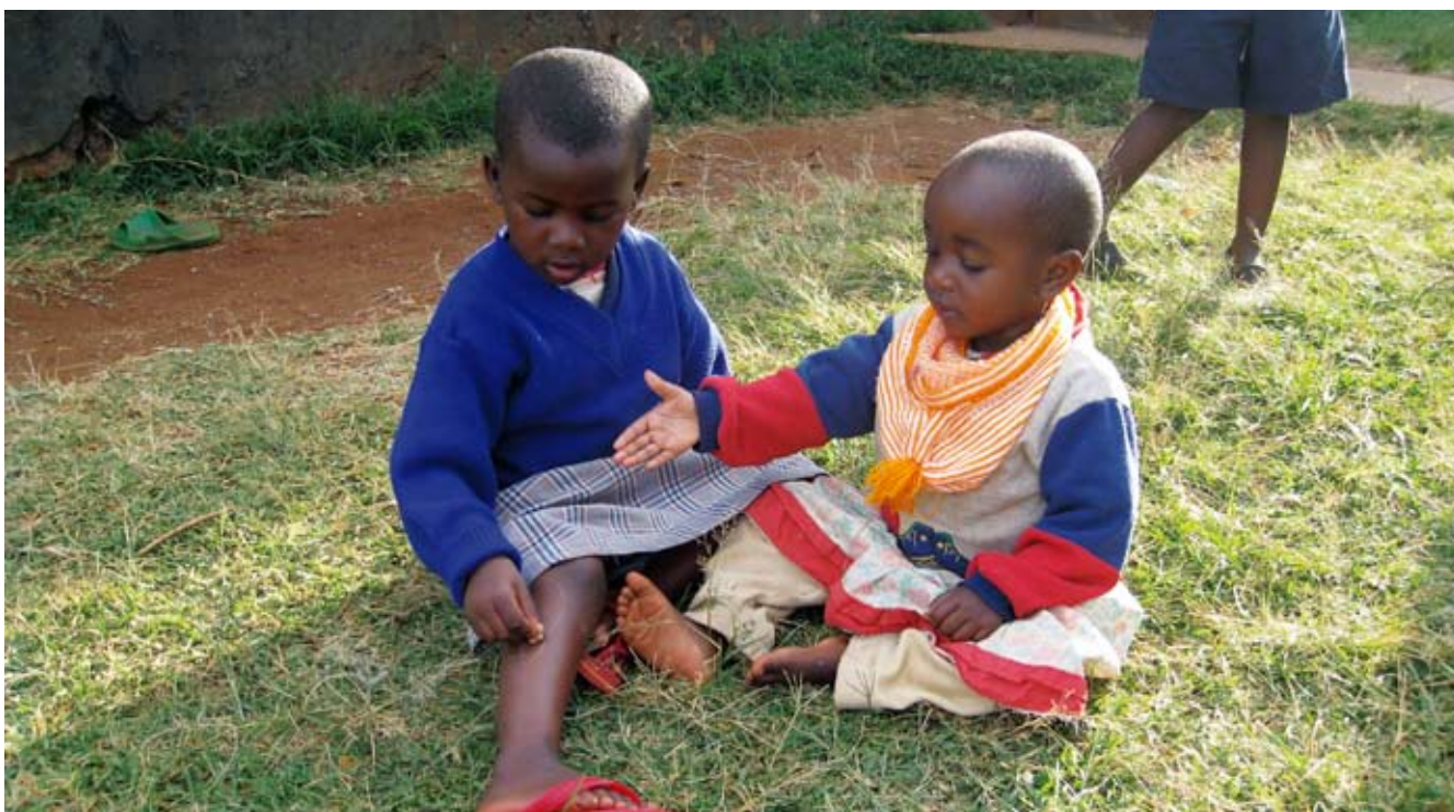
To kreative kenyanske piger leger tegneleg.

Mens AC Børnehjælp i 2008 har haft stor fremgang med såvel vores Danida-støttede udviklingsprojekter som vores fadderskaber i lande som Etiopien, Colombia, Nepal og Bolivia, er der ingen tvivl om, at adoptionsarbejdet i 2008 har haft vanskelige vilkår med historisk lave formidlingstal og stigende ventetider – en situation, som vi deler med de øvrige skandinaviske lande. Vi har imidlertid nu en begrundet forhåbning om, at vi med adoptanternes hjælp kan vende udviklingen i 2009 med en betydelig stigning i antallet af adoptioner og faldende ventetider. □