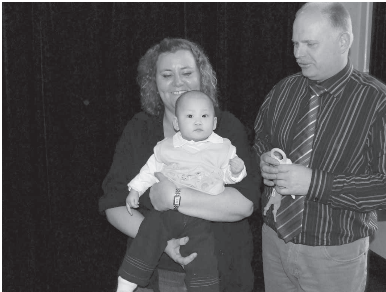
En stolt far og mor.

med sommerfugle, der baskede ret meget. Tiden inden afgang blev brugt på at få lidt at spise, stryge tøj, og hvad man nu ellers kunne finde på.