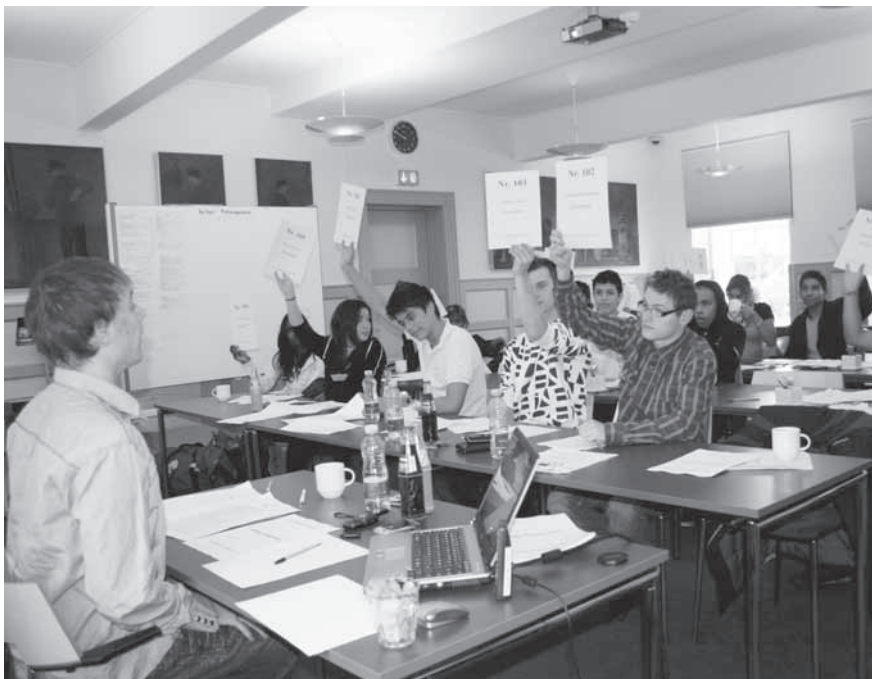
Der stemmes om formandsposten til det stiftende stormøde i Adoption & Samfund Ungdom.

På www.ungadoptert.no kan de unge adopterede læse spændende artikler om andre unge adopteredes overvejelser om adoption og identi-