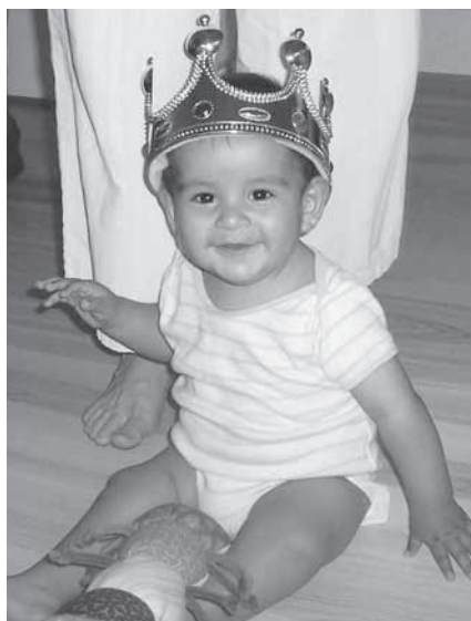
Prins Christian på 8 mdr. er født i Bolivia. Foto illustrerer ikke artiklen.

da de fleste ord ligner de danske, skulle der være god mulighed for at få glæde af de mange oplysninger. □