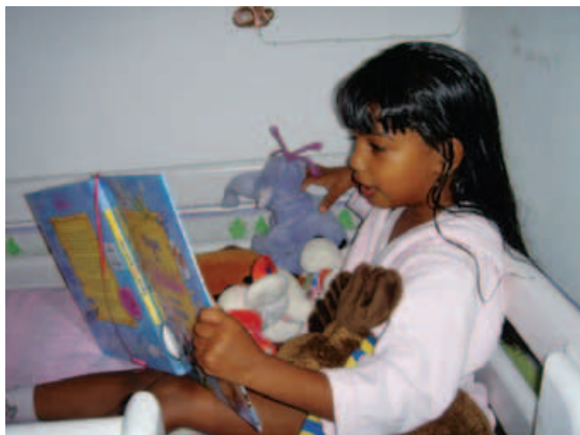
Sovedyrene skal da også have en godnathistorie. Ida er 5 1/2 år og født i Indien. Foto illustrerer ikke artiklen.