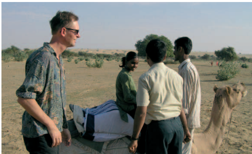
Kameltur. Kamelen ser lidt uwillig ud.

Vi var også i byen Puskar, Her boede vi på et hotel i udkanten af byen med en flot udsigt til bjergene. Vores chauffør kørte os om eftermiddagen ind til byen. Vi gik ned af en lang hovedgade med alt fra geder til gamle hippier og en masse tatoveringsbutikker, et tysk bageri osv. Det var svært at komme ned til den sø, der gør Puskar til en hellig by, for her var en gammel