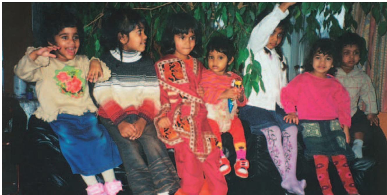
Et billede af en adoptionsgruppe. Alle børn er født i Indien.

"Et hjem med en forælder, der har mange ressourcer, kan være særdels velegnet, da børn, som er omsorgssvigtede, har særligt brug for tæt kontakt til én forælder. Ene-adoptanter er ofte ældre, de har et højt følelsesmæssigt modent niveau, høj tolerance og er meget selvstændige. De er akkurat ligeså godt rustet til opgaven, som andre adoptivforældre," siger hun.