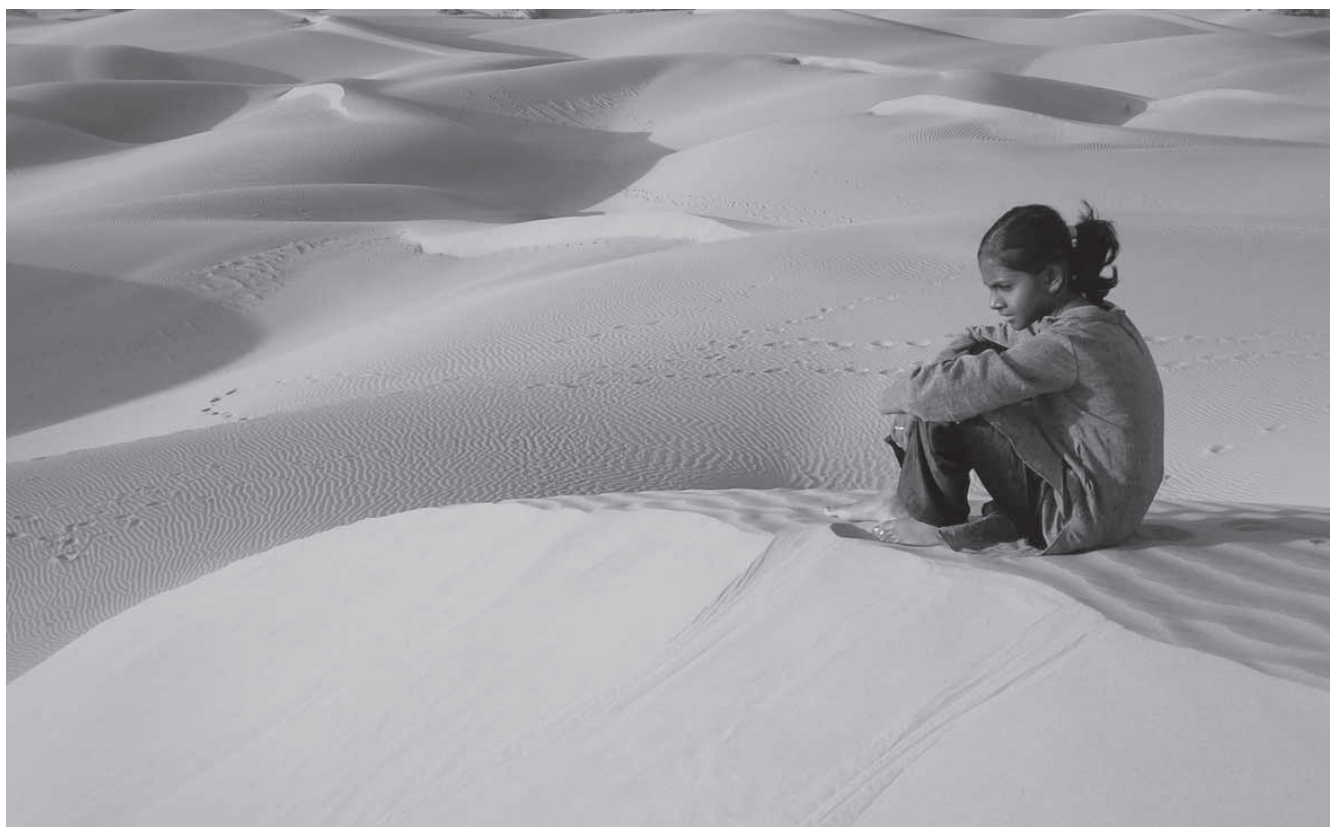
Ørken. Her er da plads til at tænke.