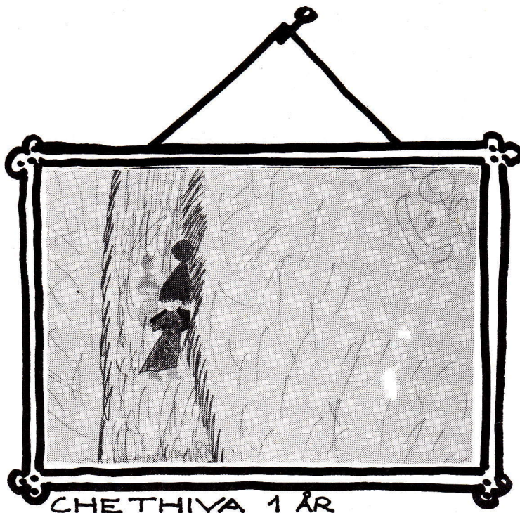
CHE THIVA 1 ÅR