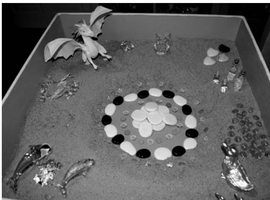
Sandplayterapi: I de to sandkasser – en våd og en tør – leger barnet frit med de valgte figurer.