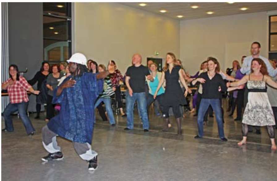
Vestafrikansk trommedans får deltagerne ud på dansegulvet på landsmødet.