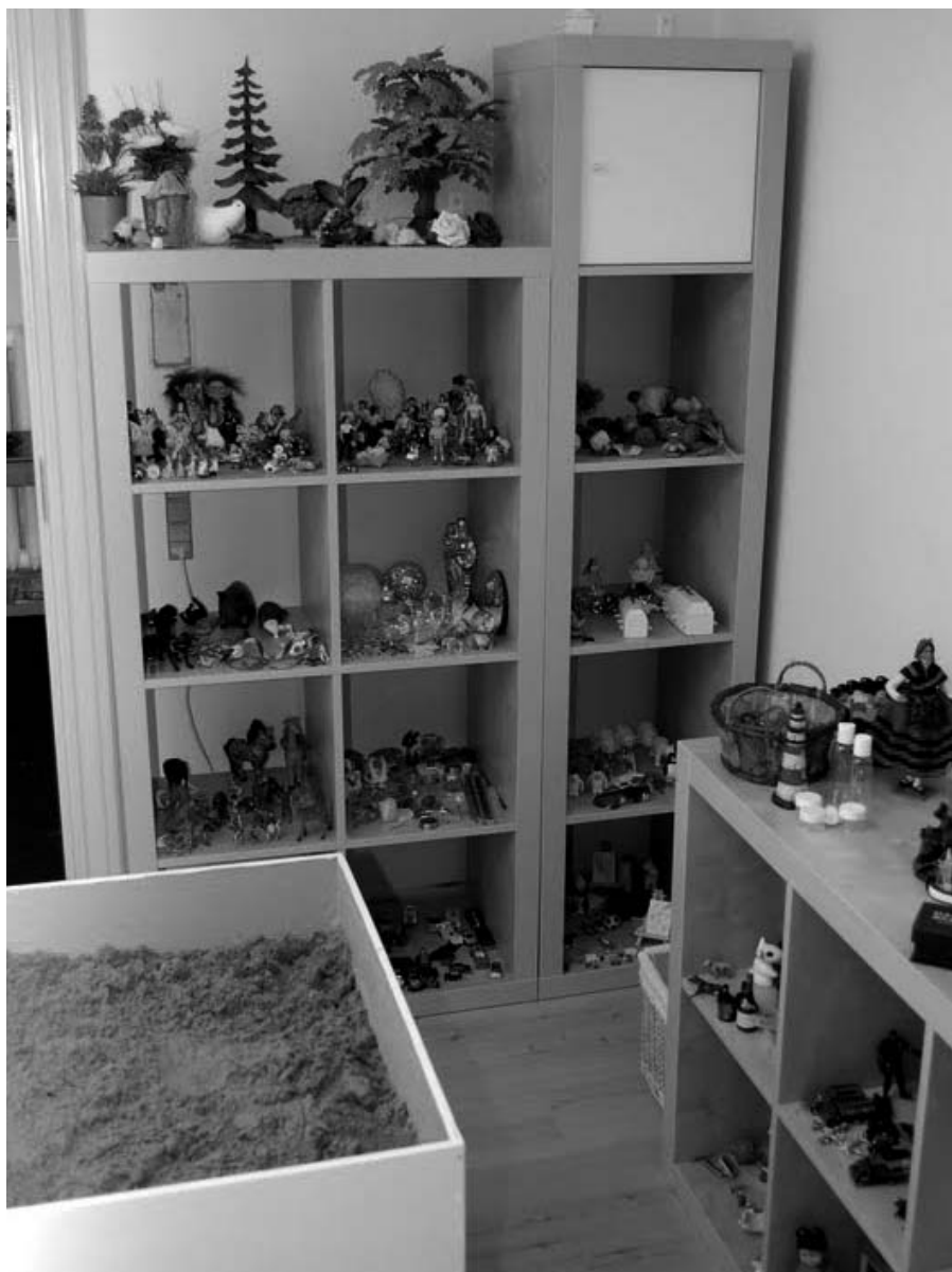
Fra en reol i konsultationen kan barnet frit vælge mellem 300-400 figurer, dukker og sten m.m.

– Det var godt nok rart at snakke så meget med Solveig i dag. ■