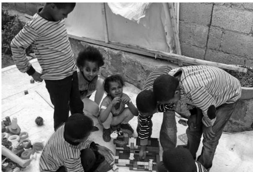
Gennem generøse donationer har børnene nu mulighed for at lege med legetøj mv.

I dag eksisterer der ikke nogen officiel uddannelse af børnehjemsplejere. Gennem det nye projekt håber vi i 121ethiopia at kunne være med til at skabe opmærksomhed om nødvendigheden af en sådan uddannelse.